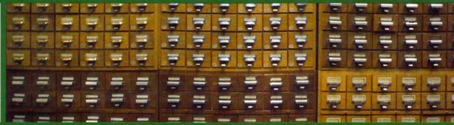
Karteikästen: Symbol der Ordnung. Auch der Kulturtransfer benötigt Rahmen und Systematiken.

lich bleiben muss. Oder es wird durch ständige Ausschweifungen so langweilig, dass man es gar nicht lesen möchte.